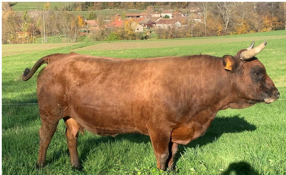
Canaille TB 87, mère de Lewis, appartenant aux Hérens des Crêts en Isère.