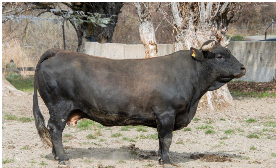
Bronne, grand-mère d'Imense FA – Reine Régionale Aoste 2019 1 ère Catégorie