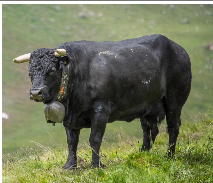
Plume, fille de Texor à Philippe Kittel

TIGRE 14 se rattache à la souche familiale Pralong à Somlaproz. LUCIFER est un fils de Louky à Gérard Evéquo, trois fois reine au combat.