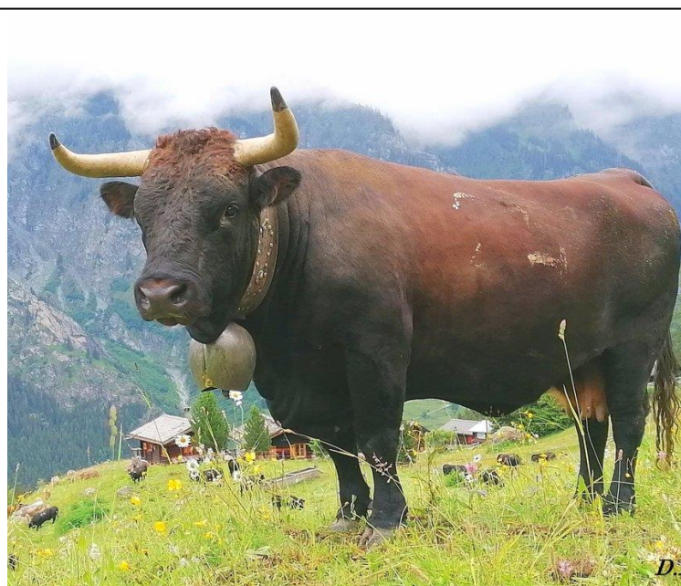
Baronne, Reine de Séry en 2021 et 2022

BRODEN , montre beaucoup de format pour son jeune âge. (Pointé 7 en profondeur, 7 en largeur ischions et 9 en sortie de cornes )